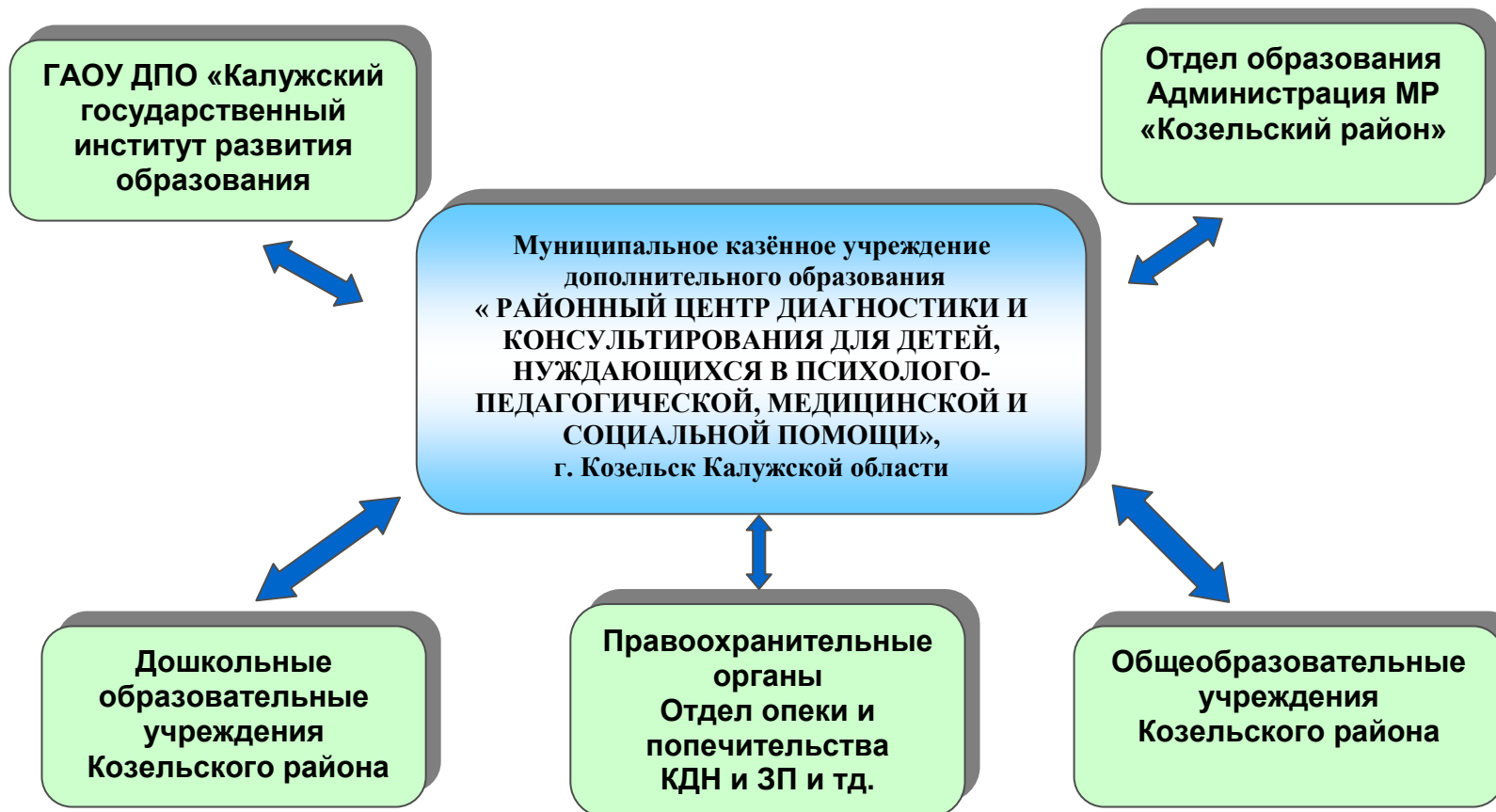
СХЕМА ВЗАИМОДЕЙСТВИЯ С ДРУГИМИ УЧРЕЖДЕНИЯМИ И ОРГАНИЗАЦИЯМИ В СИСТЕМЕ ОБРАЗОВАНИЯ